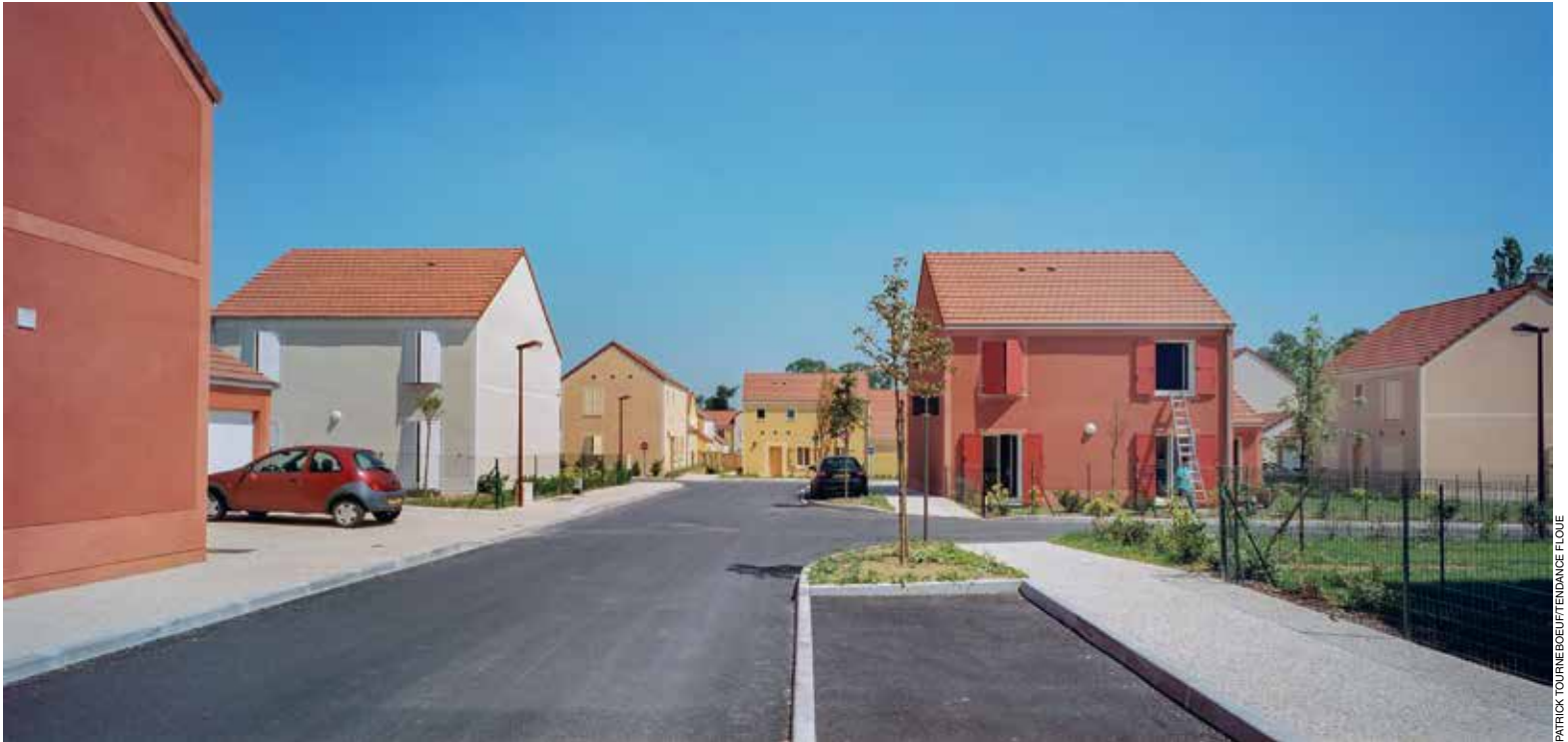
PATRICK TOURNEBOUE/LETTENDANCE FLOUE