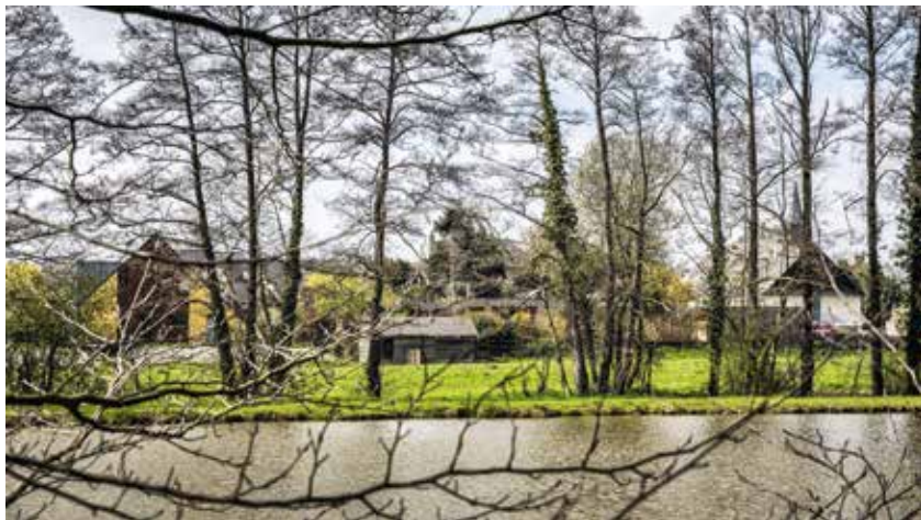
À Langouët, petit village breton, les deux lotissements ont été construits dans une dent creuse du bourg pour l'un et au cœur du village pour l'autre.

financer l'outil d'aide à l'inventaire des gisements fonciers au service des collectivités (Cartofriches), et l'outil d'appui à leur reconversion (Urban-Vitaliz), tous deux élaborés par le Cerema (2). Il aidera aussi à la réhabilitation des friches en cas de pollution, au renouvellement urbain et à faire émerger des sites prêts à l'emploi favorisant la relocalisation d'activités. Ce fonds pourra également couvrir les déficits d'opérations pour les projets situés en cœur de petites centralités ou en proche périphérie urbaine. Il financera, sous forme de subvention, des projets dont l'instruction technique sera assurée par les préfets. Il alimentera d'une part des appels à manifestation d'intérêt (AMI) nationaux (portés par la DGALN et l'Ademe), le cas échéant avec une contractualisation entre État et Régions dans le cadre du Contrat de plan État-Région 2021- 2027.