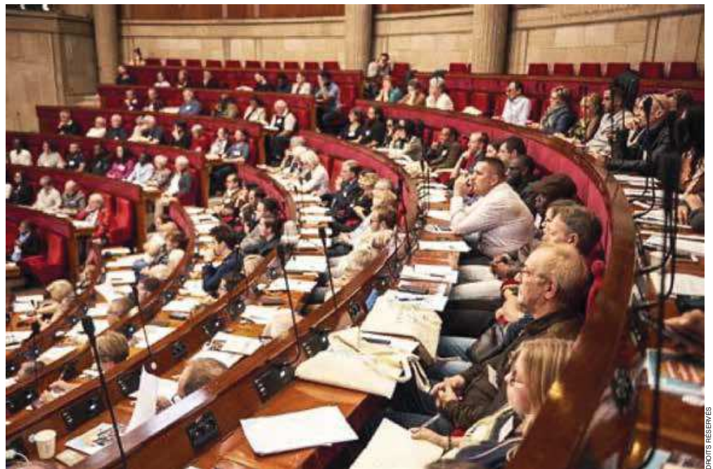
La Convention Citoyenne a dû réfléchir en parallèle à cinq politiques sectorielles.

Au sein des exécutifs locaux, municipalités comme intercommunalités, le jeu est plus subtil, dans l'ajustement entre l'établissement de l'organigramme et la répartition des rôles. Les règles d'affec-